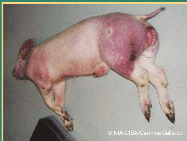
Krvavi proljev i crvenilo na koži vrata, grudni i nogu

ASK se manifestira različitim kliničkim znakovima. Zaražene, bolesne svinje uglavnom ugibaju. Obično se javlja gubitak apetita, ležanje i nevoljkost, a svinje brzo i iznenada uginu. Rijetko se pojavljuju drugi klinički znakovi: potištenost, gubitak tjelesne težine, krvarenja na koži (vrhovi uški, rep, noge, grudna i trbušna regija), otežano kretanje i pobačaji krmača. Klinički znakovi se teže uočavaju u divljih svinja.