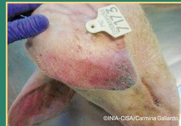
Cijanozna – plavo ljubičasta boja na vrhovima uški