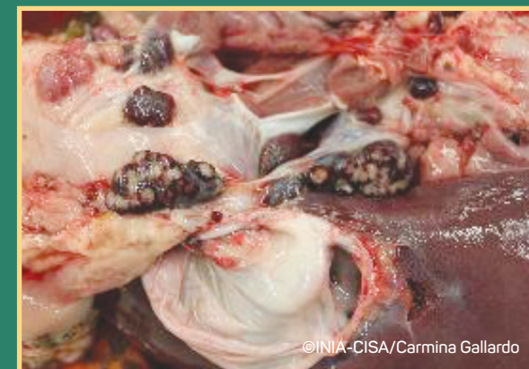
Krvavi limfni čvorovi